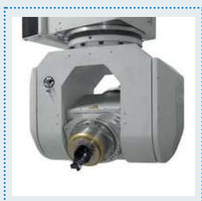
Unidad de fresado de 5 ejes con tecnología de accionamiento directo.