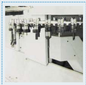
Cambiador de herramientas de alta velocidad de hasta 60 estaciones.