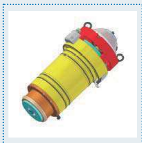
Electrohusillos totalmente diseñados y fabricados por CMS. La gama incluye 2 modelos: 18 y 32 kW. El modelo de 32 kW es un eje controlado sincrónico.