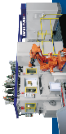
MILL-TURN MULTI-SPINDLE MACHINES