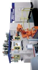
MILL-TURN MULTI-SPINDLE MACHINES