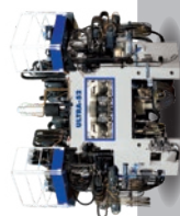
FLEXIBLE TRANSFER MACHINES