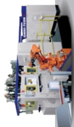
MILL-TURN MULTI-SPINDLE MACHINES