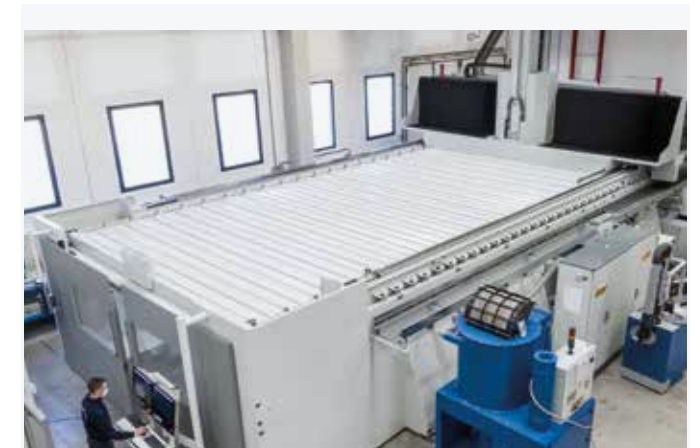
Cierre superior de fuelle para contener polvo y virutas