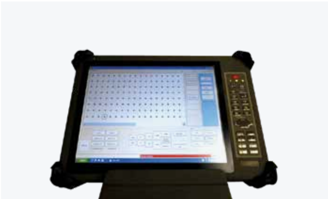
TABLET DE CONTROL Y GESTIÓN DE LA MESA UHF Software de programación de la mesa y control antichoque directamente integrados en el CAD/CAM