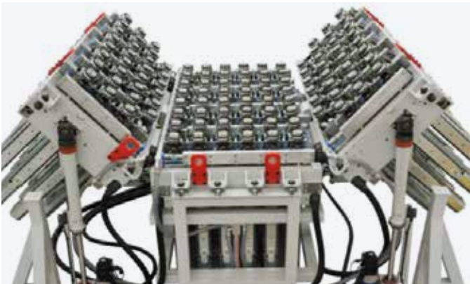
MESA OSCILANTE UHF La parte central de la mesa es fija mientras las dos alas laterales pueden inclinarse hasta 45°; la inclinación se controla mediante CN. La mejor solución para trabajar partes con radios de curvatura mínimos