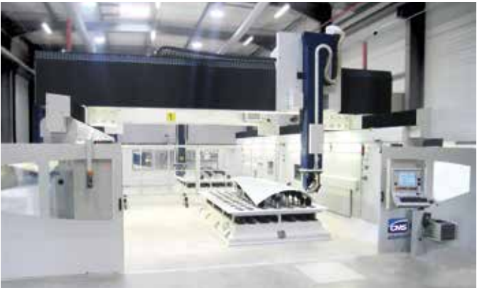
MESA UHF MATRIX Estructura de carpintería con actuadores plug-and-play

Las mesas Universal Holding Fixtures (UHF) de CMS están disponibles en diferentes configuraciones: horizontal, vertical, oscilante, monoeje, multieje (incluida una solución patentada de 5 ejes) y en todos los tamaños necesarios para ser integradas en los distintos modelos existente de Ethos.