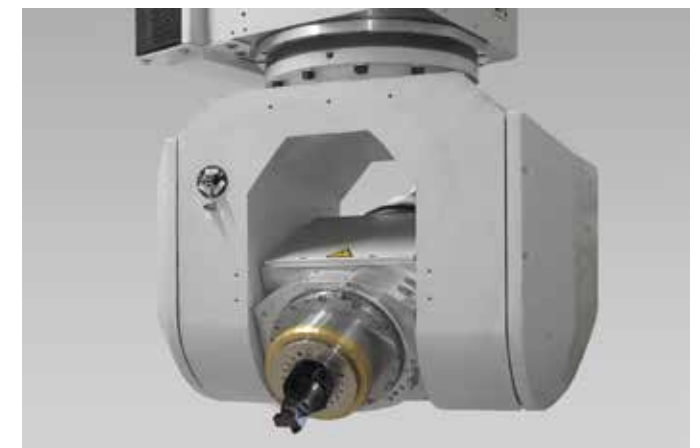
Unidad de horquilla FX5 con doble motorización de par