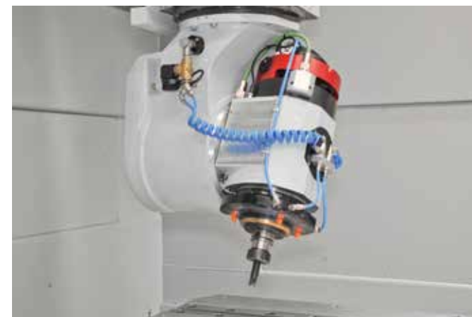
Cabezal de corte de 5 ejes con tecnología de accionamiento directo