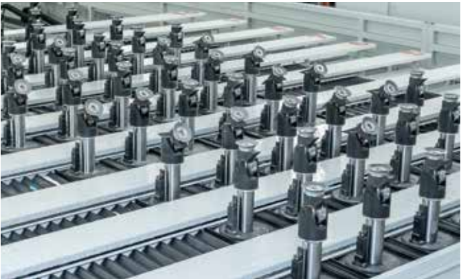
MESA UHF 3/5 EJES Este sistema permite colocar los actuadores, y por tanto las ventosas, allí donde se requiera un mayor apoyo durante el trabajo