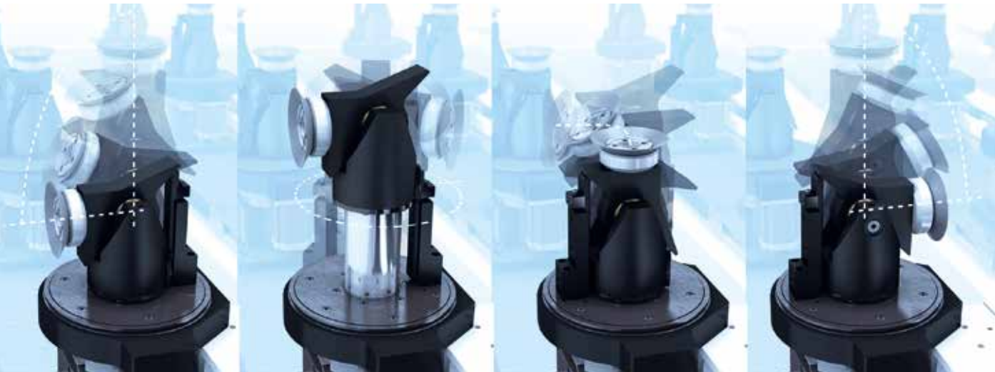
ACTUADOR 5X CON ORIENTACIÓN ESPACIAL CONTROLADA POR NC (0-90 ° / 360 °)