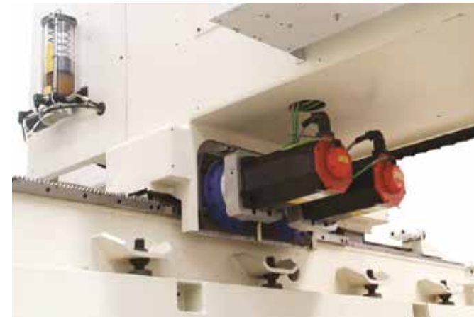
Cinemática con recuperación del juego eléctrico (doble motor) para garantizar una mayor rigidez y precisión